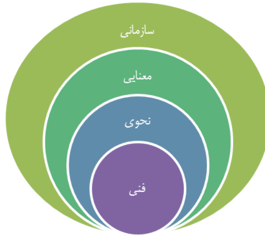
شکل ۱: سطوح هم‌کنش‌پذیری

از هم‌کنش‌پذیری امکان یکپارچه‌سازی فرآیندهای کسب‌وکار و جریان کاری فراتر از مرزهای یک سازمان مورد بررسی قرار می‌دهد [۲]. هم‌کنش‌پذیری سازمانی به معنای توانایی سازمان‌ها برای ارتباط مؤثر و انتقال معنادار داده (اطلاعات)