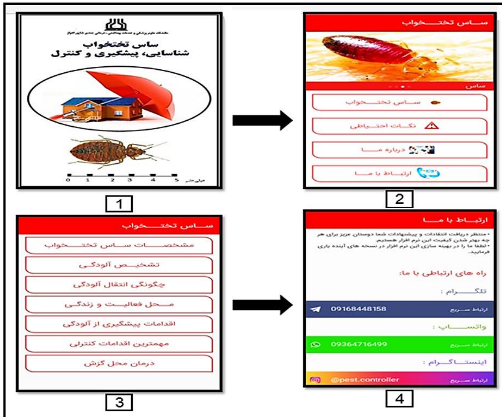
شکل ۱: نمایی از صفحات اصلی نرم افزار آموزشی «شناسایی، پیشگیری و کنترل ساس تختخواب»