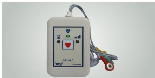
شکل ۱: یک نمونه از دستگاه Tele E.C.G

یکی از پرکاربردترین انواع سیستم‌های پزشکی از راه دور سیستم Tele E.C.G می‌باشد که نوعی Tele Cardiology است و در دو دهه اخیر کاربرد بسیار زیادی داشته است. Tele E.C.G حوزه بسیار وسیعی از برنامه‌های کاربردی را در بر می‌گیرد [۱۴]. با توجه به گستره جغرافیایی وسیع کشور، دارا بودن جمعیت روستایی زیاد، کمبود منابع و پزشکان متخصص در این مناطق و فاصله جغرافیایی بسیار زیاد با مراکز مجهز به امکانات بهداشتی- درمانی پیشرفته، استفاده از Tele Cardiology و مخصوصاً Tele E.C.G (شکل ۱) که یکی از مهم‌ترین کاربردهای آن می‌باشد بسیار کمک کننده و سودمند خواهد بود؛ در همین راستا در این مقاله ضمن تشریح مفهوم Tele E.C.G، کاربردها، زیرساخت‌ها و اهمیت استفاده از آن نیز مورد بحث و بررسی قرار گرفته است.