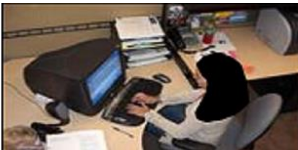
شکل ۴: طراحی میز رایانه

میدان بینایی کلی صفحه مانیتور باید مشخص باشد. بنابراین زاویه دید کاربر وقتی که در هر یک از چهار وضعیت استاندارد نشستن قرار دارد، بیشتر از ۶۰ درجه نمی‌باشد. در وضعیت نشسته که کاربر متمایل به عقب است، خط دید وی موازی با سطح زمین نمی‌باشد. در این حالت زاویه دید بیشتر به سمت پایین متمایل می‌شود. استفاده از مانیتورهای بزرگ نیز ممکن است این زاویه را افزایش دهد. اگر مانیتور روی کیس یا وسایل دیگر قرار گیرد، مانیتور خیلی بالا می‌آید. بنابراین باید این وسایل را از زیر مانیتور برداشت. این حالت فقط برای افراد خیلی قدبلند مشکلی ایجاد نمی‌کند. با بالا آوردن صندلی می‌توان خط دید را بالاتر برد. البته باید فضای کافی برای پاهای در زیر میز و همچنین برای زیر پای وجود داشته باشد. جهت حفظ وضعیت مناسب گردن برای افرادی که عینک دوکانونی دارند باید مانیتور در سطحی پایین‌تر قرار داده شود.