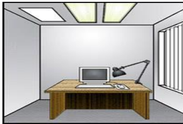
شکل ۸: تنظیم نور در محیط کار

برای جلوگیری از خیرگی و استفاده بهینه از روشنایی، بایستی ردیف های چراغ ها را موازی با خط دید روی سقف نصب نمود و میز کار، به پنجره نزدیک باشد. بدین وسیله می توان از نور طبیعی برای خواندن و یا نوشتن استفاده کرد. در عین حال باید از تابش نورهای خیره کننده و براق جلوگیری کرد و از پرده و کرکره می توان برای حذف اشعه آفتاب استفاده کرد (شکل ۸). پرده ها و قرارگیری میز کار باید طوری طراحی شود که اجازه دهد نور به اتاق وارد شود اما مستقیماً در حوزه کاری نتابد. پرده های عمودی برای پنجره های غربی - شرقی و پرده های افقی برای پنجره های شمالی - جنوبی مناسب می باشد. باید سعی شود از نور و روشنایی غیر مستقیم تا جای ممکن استفاده شود و از روشنایی زیاد از حد در میدان بینایی خودداری گردد. علاوه بر این لامپ ها باید نورگیر داشته باشند تا نور مستقیم در خط دید کاربر نباشد. با توجه به این که لایه های گرد و خاک