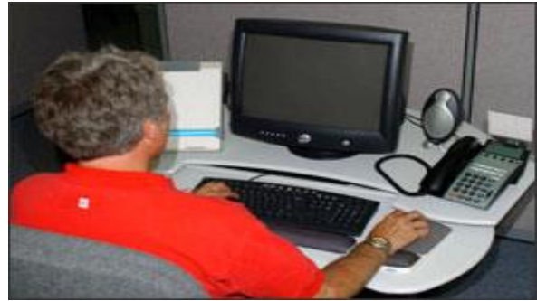
شکل ۳: وضعیت مناسب مانیتور

اگر میز کار به خوبی طراحی شده باشد و به خوبی قابل تنظیم باشد، فضای کافی برای پاها وجود خواهد داشت. همچنین کلیه اجزای رایانه به طور مناسب جا داده می‌شوند و از وضعیت‌های بدنی نامطلوب و دردناک جلوگیری می‌شود. میز رایانه باید به گونه‌ای طراحی شود که مانیتور در زاویه میز (گوشه) قرار گیرد و فضای مناسب برای وسایل فراهم گردد (شکل ۴). وسایلی که به طور مرتب استفاده می‌شوند (صفحه کلید، تلفن، ماوس) باید در دسترس باشد یعنی در منطقه اولیه فضای کاری روی میز گذاشته شوند (Primary repetitive work). (شکل ۵)