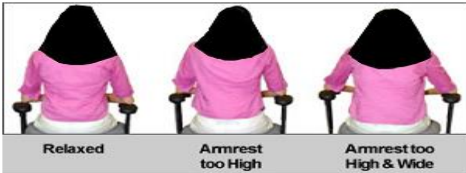
شکل ۱: وضعیت‌های مختلف بازو با دسته صندلی

عمق قابل تنظیم باشد. ارتفاع نشستگاه صندلی وقتی مناسب است که کف پا به طور کامل بر روی سطح زمین قرار گیرد و زانوها از قسمت نشستن روی صندلی مقداری بالاتر باشد و زاویه ۹۰ درجه بین ران و ساق پا ایجاد گردد. لبه‌های صندلی باید حالت گرد و آبشاری داشته باشند و بر روی قسمت زیر زانو فشار وارد ننماید. نشستگاه باید فضای کافی برای قرارگیری لگن داشته باشد. صندلی‌هایی که نشستگاه آن‌ها بزرگ است برای افرادی که سایز بدنی بزرگی دارند استفاده می‌شوند. در صورتی که امکان تنظیم ارتفاع صندلی وجود نداشته باشد، از زیر پایی جهت بالا بردن زانوها برای جلوگیری از فشار روی قسمت پشت ساق پا استفاده شود. باید از مواد نرم ساخته شود