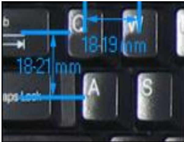
شکل ۶: فاصله افقی و عمودی مرکز دو کلید

اندازه و فاصله بین کلیدهای صفحه کلید باید مناسب باشد. معمولاً فاصله افقی مرکز دو کلید باید ۰/۷۱ تا ۰/۷۵ اینچ (۱۸ تا ۱۹ میلی‌متر) و فاصله عمودی باید ۰/۷۱ تا ۰/۸۲ اینچ (۱۸ تا ۲۱ میلی‌متر) باشد (شکل ۷) [۱۹].