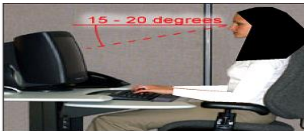
شکل ۲: وضعیت مناسب کاربر با مانیتور و صفحه کلید

پشت درست جلوی مانیتور است و مانیتور نباید بیشتر از ۳۵ درجه به سمت راست یا چپ باشد. برای نگارش مطالب باید آن‌ها را مستقیماً در جلوی خود گذاشت و آن‌ها را تا جایی که ممکن است نزدیک مانیتور قرار داد. قسمت بالای مانیتور باید تا حدی پایین یا در سطح چشم‌ها قرار گیرد و مرکز مانیتور باید به طور نرمال ۱۵ تا ۲۰ درجه زیر سطح افقی چشم‌ها قرار بگیرد [۱۵]. (شکل ۳)