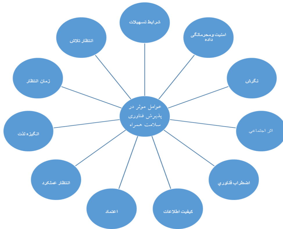
شکل ۱: مدل تحقیق

بسیاری از تحقیق‌های انجام گرفته در ایران درباره فناوری