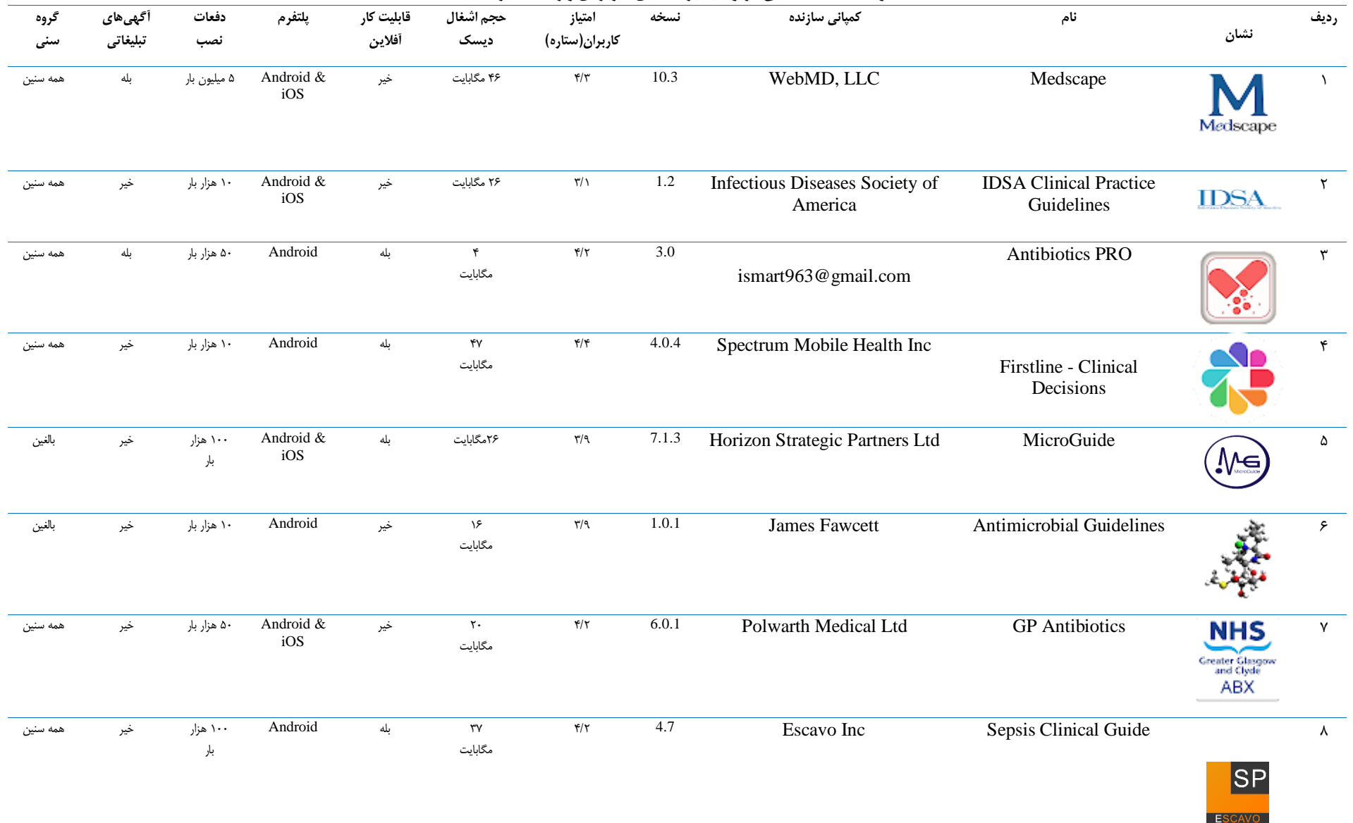
جدول ۲: اطلاعات کلی مربوط به برنامه‌های کاربردی وارد شده در مطالعه