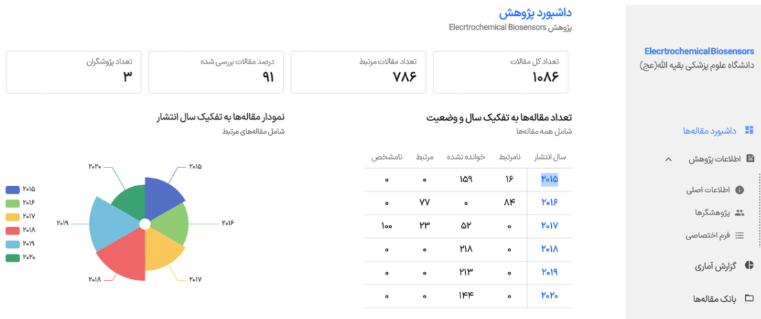
شکل ۵: دانشپورد مقاله‌ها برای پژوهش پایه «زیست حسگرهای الکتروشیمیایی»