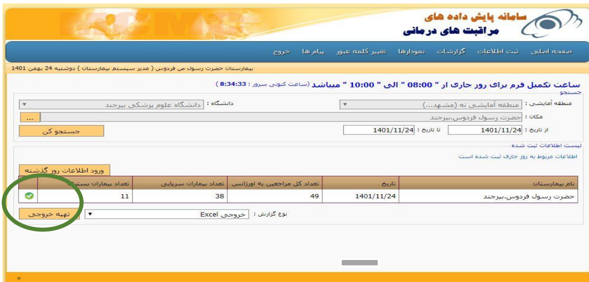
شکل ۱: نمونه ای از مشکلات مربوط به نقض اصل تطابق سیستم با دنیای واقع