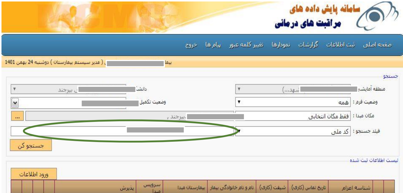
شکل ۳: نمونه‌ای از مشکلات مربوط به نقض اصل زیبایی‌شناسی و طراحی حداقل

قسمت پیام‌ها بود که درجه شدت ۲ رابه خود اختصاص داد (شکل ۴).