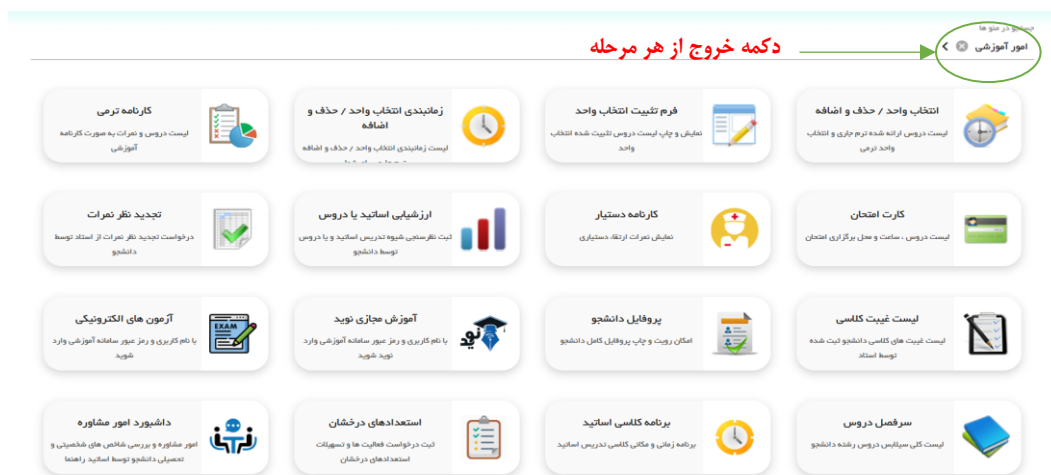
شکل ۲: نمونه‌ای از مشکلات مربوط به نقض اصل آزادی عمل کاربر و تسلط بر سیستم

در مورد رعایت مؤلفه «رعایت یکنواختی و استانداردها»، نظر ۶۷/۸۲ درصد ارزیابان مثبت و ۳۲/۱۷ درصد دارای نظر منفی بودند. گروهی که دارای ارزیابی منفی بودند میانگین شدت مشکلات مربوط به این مؤلفه را ۰/۶۸ گزارش کردند که نشان می‌دهد از نظر آن‌ها عدم رعایت مؤلفه ثبات و استانداردها در سامانه سپیاد یک مشکل جزئی است. در طراحی سامانه سپیاد از رنگ‌های تند و واضح برای جلب توجه استفاده نشده بود که منجر به نقض اصل ثبات و استانداردها شده بود.